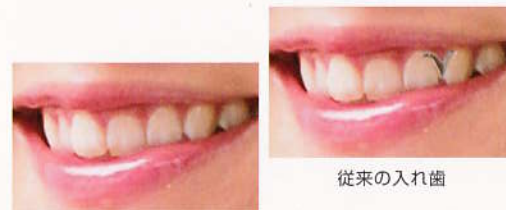
エステティックデンチャー