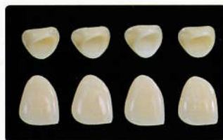
異なるフレーム材を使用した補綴物*

さらにこれらの修復物には、すべて同じ陶材 IPS e.max セラム 築盛が可能で、一口腔内で同じシステムを使用することで、統一感のある審美性を得ることができます。